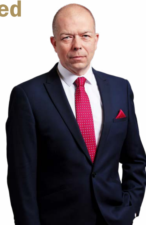
Zadavatel/Zpracovatel: Koalice ODS a KDU-ČSL

O operaci Anthropoid – atentátu na Reinharda Heydricha – již bylo napsáno mnohé a jména dvou jejích hlavních aktérů, rotmistrů Josefa Gabčíka a Jana Kubiše, zná každý. Svůj úkol by však nikdy nemohli splnit bez pomoci stovek statečných vlastenců, kteří jim nezištně pomáhali. Naprostá většina z nich za to zaplatila životy svými, i svých nejbližších. Nemalá část těchto statečných mužů, žen a dokonce i dětí žila v ulicích dnešní Prahy 9.